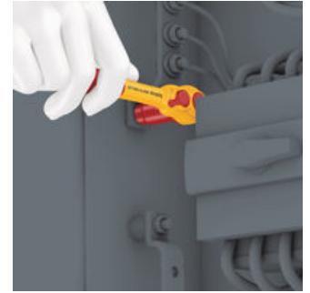
Durch ihre extrem schlanke Bauform ermöglicht die Zyklop VDE-Knarre einfaches Arbeiten auch in sehr engen Bauräumen.