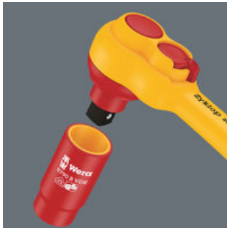
Die Kugelarretierung sorgt für sicheren Sitz der Nüsse und des Zubehörs und damit auch für verlässliche Sicherheit während des Verschraubens.