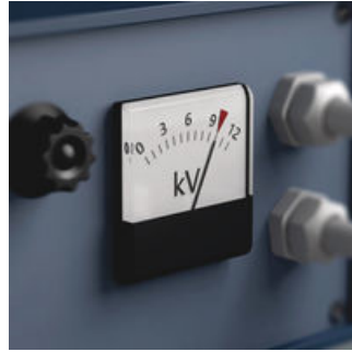
Die Stückprüfung der Zyklop Werkzeuge für Elektriker bei 10.000 Volt gemäß IEC 60900 garantiert sicheres Arbeiten unter Spannung bis 1.000 Volt.