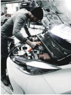
Zyklop Knarre und Zubehör für Elektriker