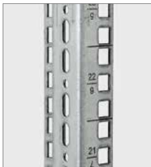
RAX-VL-Xxx-X1 Vertikale Montageleiste. Kennzeichnung der Höheneinheiten durch Laser.