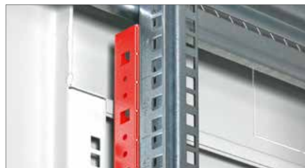
RAX-VR-Txx-X2 Ein zusätzliches Profil erhöht die Stabilität der vertikalen Montageleisten (4 St.). Es steigert die Tragkraft des Verteilers auf 1500 kg. Verwendbare