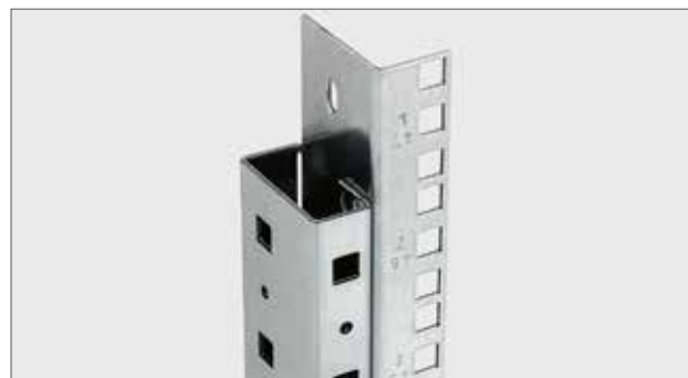
RAX-VL-Dxx-X1 Verstärkte vertikale Montageleiste für die RDA- und RDE-Verteiler. Sie wird auch in 800 mm breiten RXA-Verteilern installiert. Kennzeichnung der Höheneinheiten eingestanz.

Bestandteil jeder Montageleiste ist Beipack, der beinhaltet: Höhe der Leiste bis 22U (einschließlich) Schraube M5 x 12 ..... 2 Stücke spezielle großflächige Mutter M5 ..... 2 Stücke Höhe der Leiste ab 23U Schraube M5 x 12 ..... 3 Stücke spezielle großflächige Mutter M5 ..... 3 Stücke