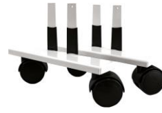
Zubehör: Laufrollen VZ-VF-LR