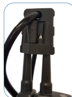
Schutzkappe mit Aufnahmefach für Metallhülsen