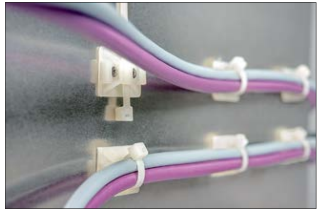
Befestigungssockel der TY-Serie sind als Schraub- oder Klebesockel erhältlich.