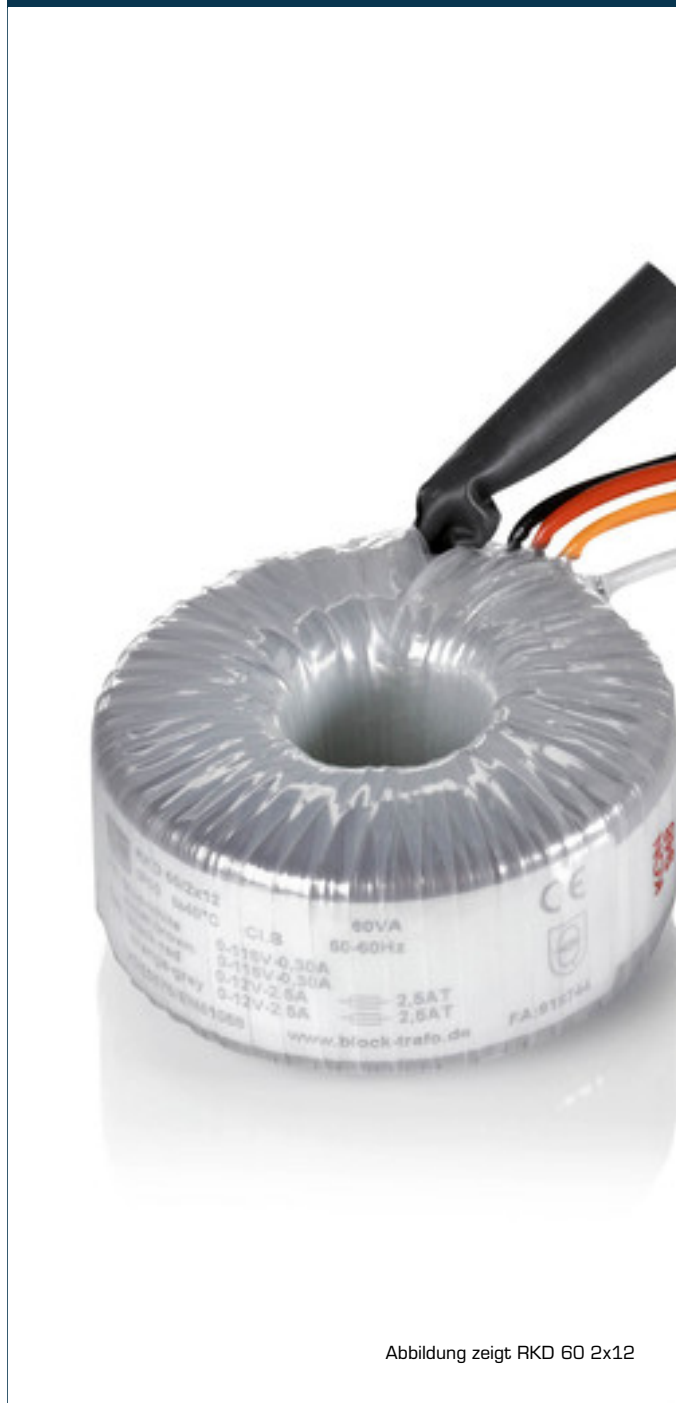
Abbildung zeigt RKD 60 2x12