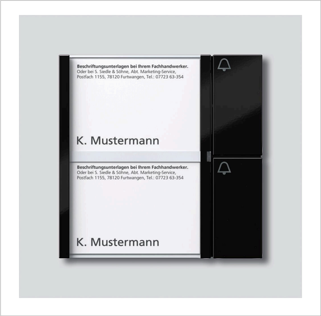
Tasten-Modul TM 612-2 SH 200038755-00

Tasten-Modul mit Namensschildtasche, 2 Namensschildern und 2 separaten Ruftasten mit Glockensymbol.