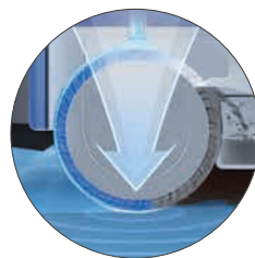
Extremer Druck und hohe Geschwindigkeit erhöhen Leistung und Stabilität