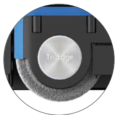
MagicScour Wischmopp Verstärkte Hochdruck-Nylonborsten zur Beseitigung hartnäckiger Flecken