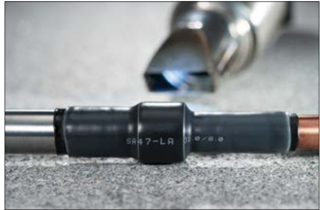
SA47-LA dichtet zuverlässig ab - auch bei schwierigen Geometrien.