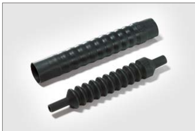
313C722-9 ungeschumpft und vollständig geschrumpft.

Weitere Informationen zu Material und Klebstoff auf Seite 274 und 275.