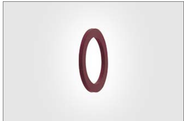
HelaGuard AFWS Dichtungsscheiben aus Vulkanfiber.