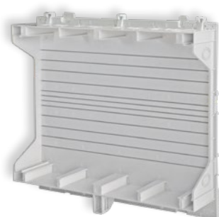
homePOP XL Basic