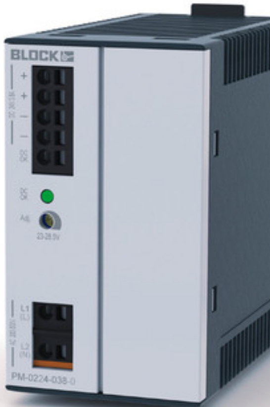
Abbildung zeigt PM-0224-038-0