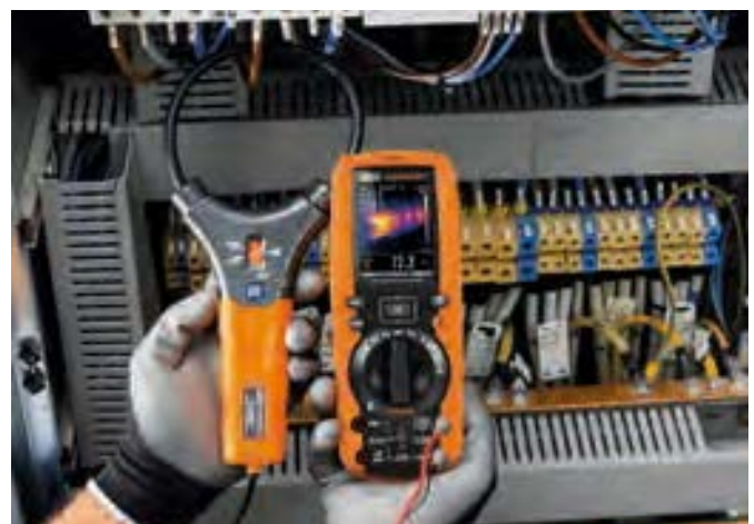
AC Strommessung mit flexiblem Wandler F3000U mit Wärmebildanzeige.