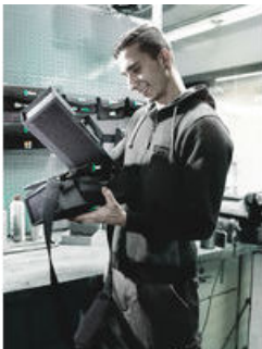
Wera 2go 1 – Der Dranpacker