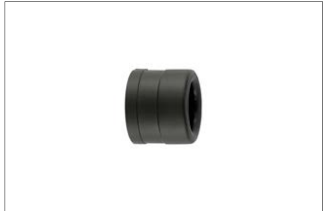
HelaGuard PAEC Endverschluss.