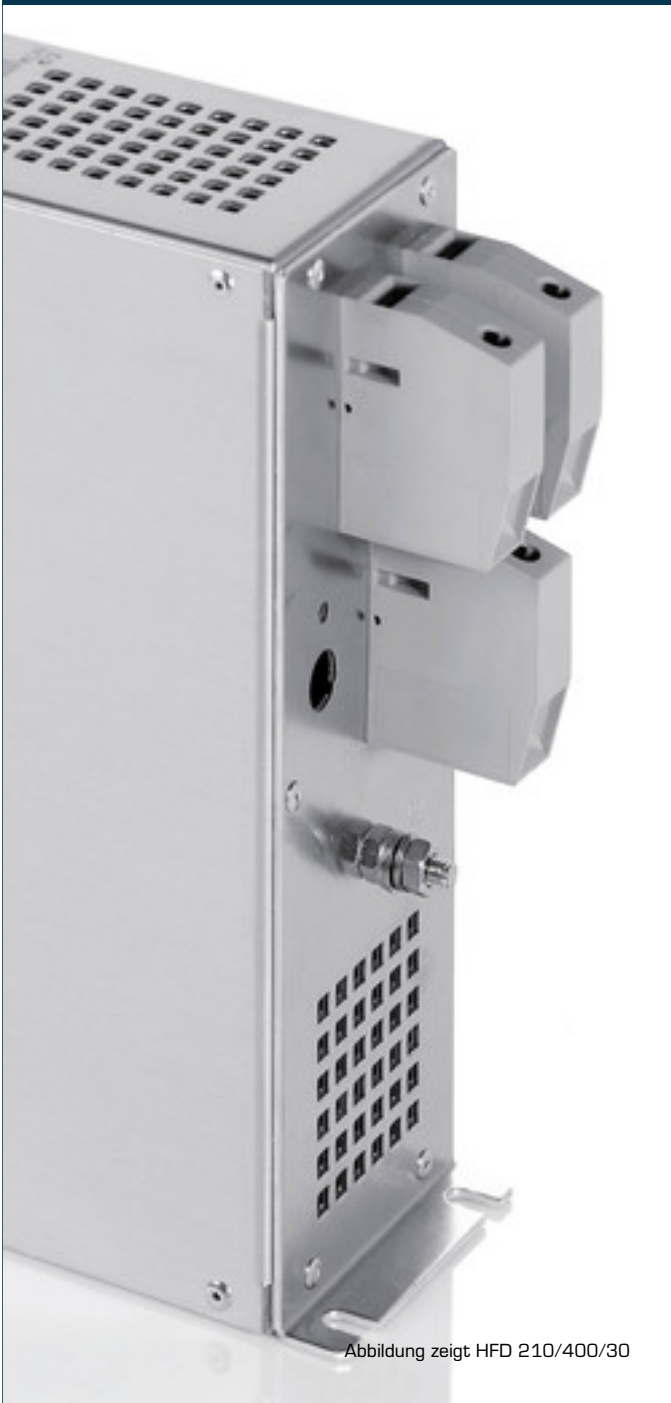
Abbildung zeigt HFD 210/400/30