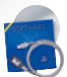
USB Kabel + Topview Software