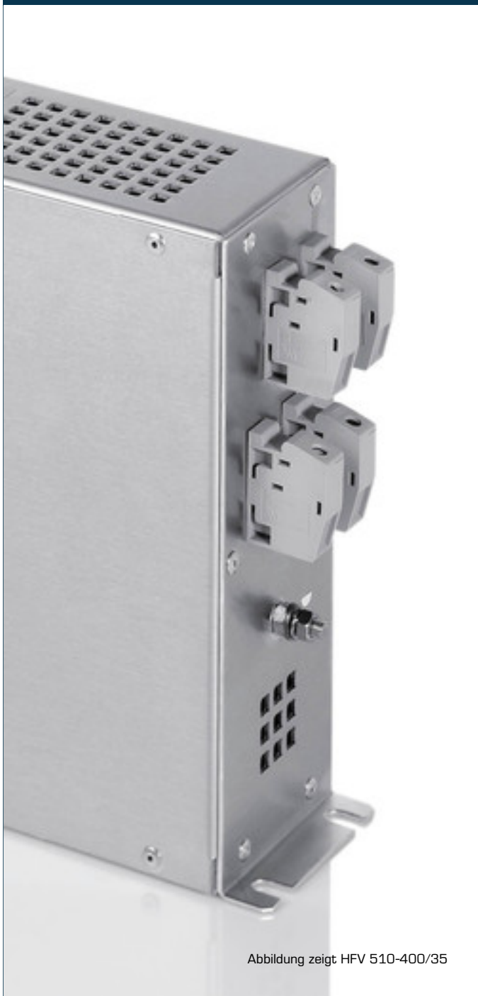
Abbildung zeigt HFV 510-400/35