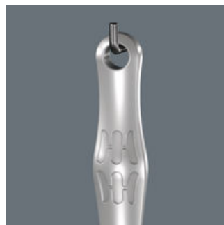
Joker 6004: Praktisches Aufhängeloch

Durch das Aufhängeloch kann der Joker ordentlich an der Werkstattwand untergebracht werden.