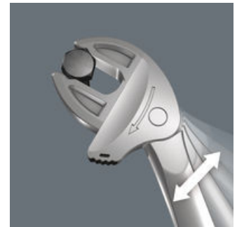
Joker 6004: Ratschenmechanik für schnelles Arbeiten

Die Ratschenfunktion im Maul sorgt für schnelles und durchgängiges Schrauben ohne Absetzen.