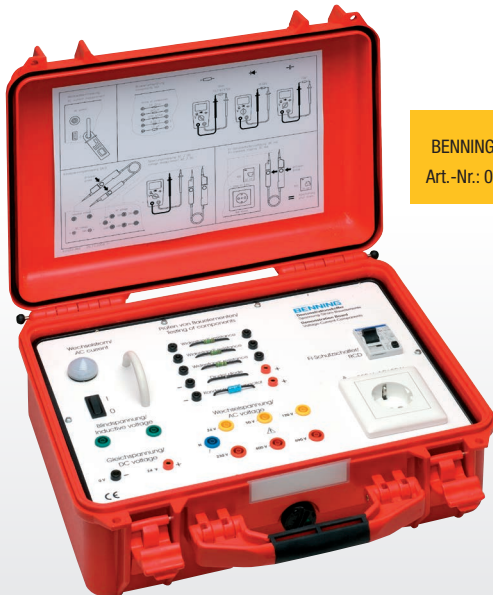
BENNING DB 1 Art.-Nr.: 044132