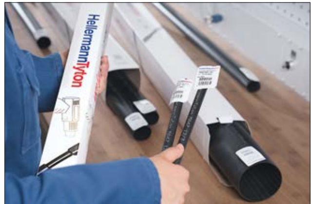
TREDUX Schrumpfschläuche für kleinere Bedarfe in der Elektrotechnik.