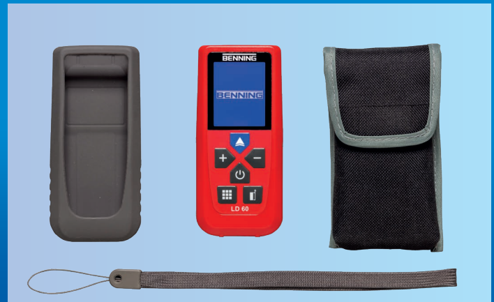
Lieferumfang LD 60