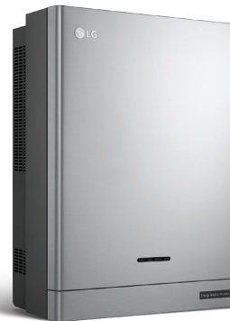
LG ESS Home 8 | 10 D008KE1N211 D010KE1N211