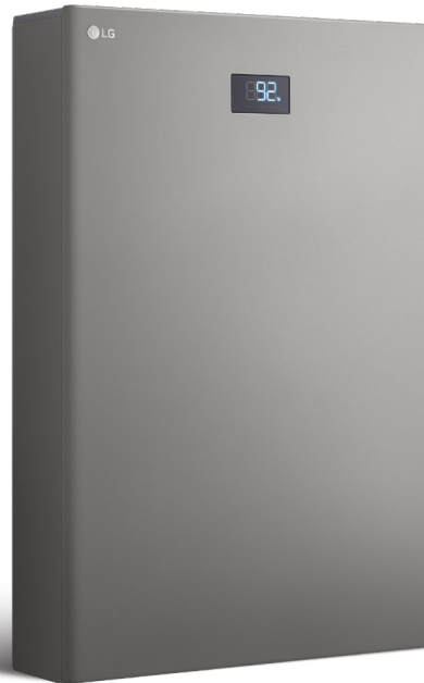
LG HBC Batterie 11H | 15H BUEL011HBC1 BUEL015HBC1

Das LG Electronics ESS ist ein modernes Home Energy System für Hausbesitzer, die Ihren Energieverbrauch zu Hause stets unter Kontrolle haben möchten. Es stellt Tag und Nacht zuverlässig Strom aus einem hocheffizienten System bereit. Dank seiner modularen Konzeption lässt sich die nutzbare Kapazität der Batterie ohne zusätzliche Geräte bis auf 28,5 kWh erweitern.