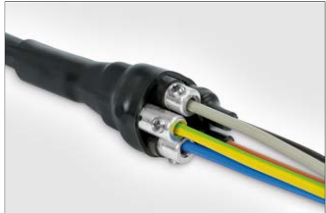
LVK-C - Warschrumpf-Verbindungsgarnitur mit Schraubverbindern.

Innenmuffen, Außenmuffe, Schraubverbinder, Reinigungstuch, Schmirgelleinen, Montageanleitung