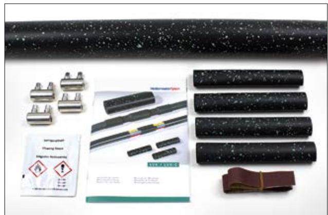
LVK-C: Innenmuffen, Außenmuffe, Schraubverbinder, Reinigungstuch, Schmirgelleinen, Montageanleitung.