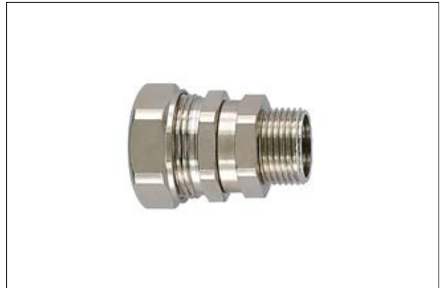
HelaGuard PSRSC-SMC drehende Kompressionsverschraubung.