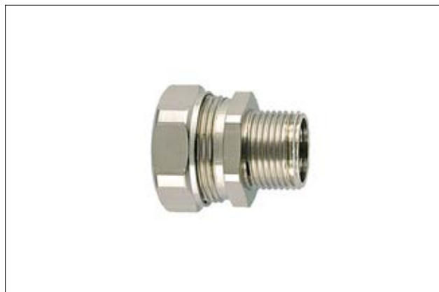
PSRSC-FMCSS gerade Kompressionsverschraubung.