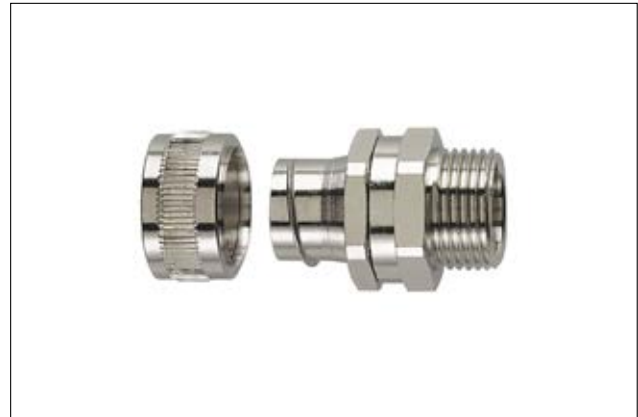
HeliaGuard SSC-SM mit drehendem Außengewinde.