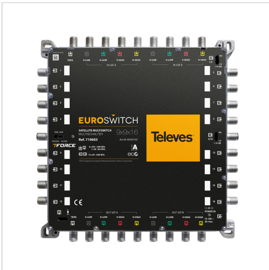
Televes behält sich das Recht vor, das Produkt zu modifizieren