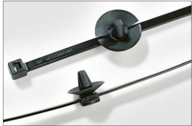
Durch die verschiebbaren Fußteile sind diese Befestigungsbinder sehr flexibel einsetzbar.