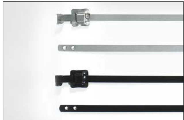
Die Metallkabelbinder der MLT-Serie sind mit und ohne beschichtung erhältlich.