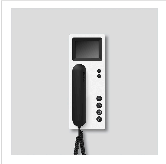
Bus-Telefon Standard mit Farbmonitor BTSV 850-03 WH/S