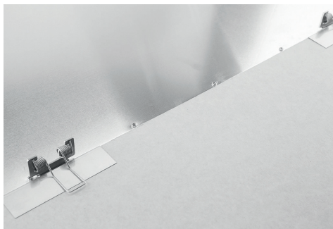
GK-Montage mit SNAP-IN Federeinbausatz