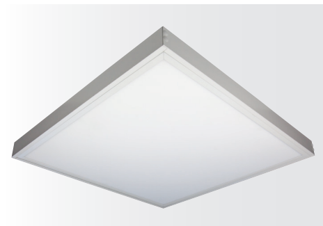
Multi-Rahmen für LED Panel SNAP, weiß