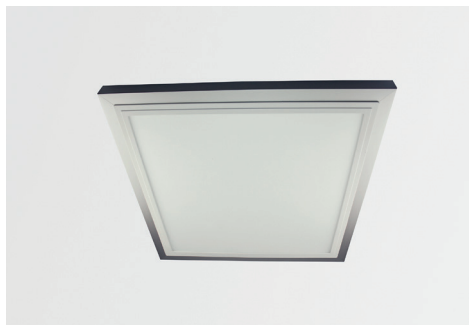
Aufbau-Montagerahmen für LED Panel SNAP, silber matt