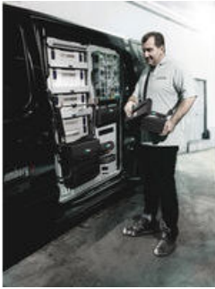
Wera 2go 1 – Der Dranpacker