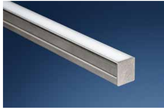
LED-Leuchten für Arbeitsplätze