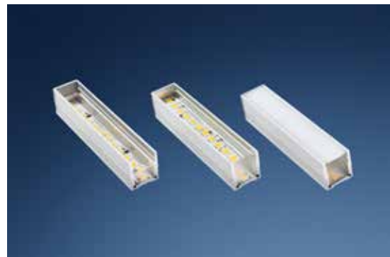
LED-Sonderlösungen für industrielle Bereiche